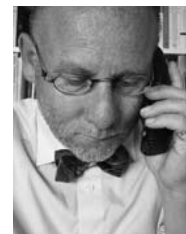
Prof. Horst Schumacher

Gefragt ist nicht das Kaschieren neuer Funktionen in alten Formen (Solardachziegel) oder das Ausblenden aus der Alltagswelt (Windkraft aus Offshore-Windparks oder aus Nordafrika, wo ebenfalls windreiche Standorte erschlossen werden könnten). Gefragt ist eine neue Form des Orts- und Landschaftsbildes, das die neue Kultur der Energie in einer Gesamtschau von rationeller Energienutzung, effizienter Energiebereitstellung, ressourcenschonendem Flächenverbrauch und qualitativ hochwertiger Gestaltung der Anlagen zum Ausdruck bringt.