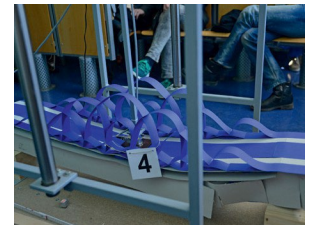
Beispiel für die Brücken-Box

Mit der Teilnahme am Schülerwettbewerb erklären sich die Teilnehmenden damit einverstanden, dass Mitarbeiter und/oder beauftragte Dienstleister Foto- und/oder Filmaufnahmen zum Wettbewerb anfertigen. Die Aufnahmen dienen nicht-kommerziellen Werbezwecken, sie sollen in eigenen Print- und Onlinemedien veröffentlicht werden und externen Medien (Print, Rundfunk, Online) zur Veröffentlichung zur Verfügung gestellt werden. Die Teilnehmenden erklären mit Ihrer Anmeldung am Wettbewerb, dass die Zustimmung zur Veröffentlichung wie vorgenannt vorliegt.