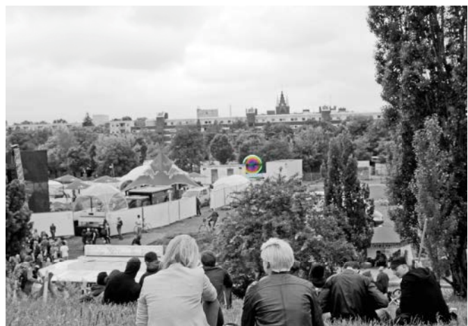
Abb. 1: Identifikation mit dem Stadtquartier

Der Statusbericht 2008 zum Programm Soziale Stadt bestätigt, dass sich Freie Träger, Schulen und Wohnungsunternehmen zunehmend in der Quartiersentwicklung engagieren. Darüber hinaus werden „(...) Weiterentwicklungen vor allem bei den Stadtteilbüros (Bedeutungszunahme als Initiatoren für Aktivierung und Beteiligung) und Netzwerken in den Programmgebieten (Intensivierung der Zusammenarbeit zugunsten des Stadtteils) konstatiert. Im Bereich Aktivierungsmaßnahmen und Beteiligungsangebote werden ebenso Verbesserungen festgestellt“ (BMVBS 2008a, 80f.).