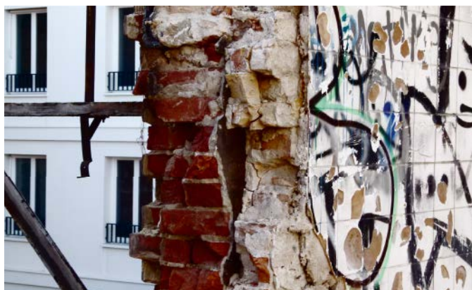
Abb. 3: Vorher – nachher: Mit Partizipation gemischte Quartiere fördern

Einer Verstetigung bedürfen außerdem die Quartierbudgets und -fonds, die mit Partizipationsprozessen Hand in Hand gehen. Sie stellen ein seit Jahren erfolgreiches Modell dar, um Bewohner in Stadtteilen mit besonderem Entwicklungsbedarf zu Engagement und Teilhabe an ihrem Lebensumfeld zu motivieren, ihre Mitwirkung und Selbstverantwortung konkret zu unterstützen sowie sie in ihrer Entscheidungskompetenz und in ihrem Engagement wertzuschätzen (vgl. BMVBS 2011). 2