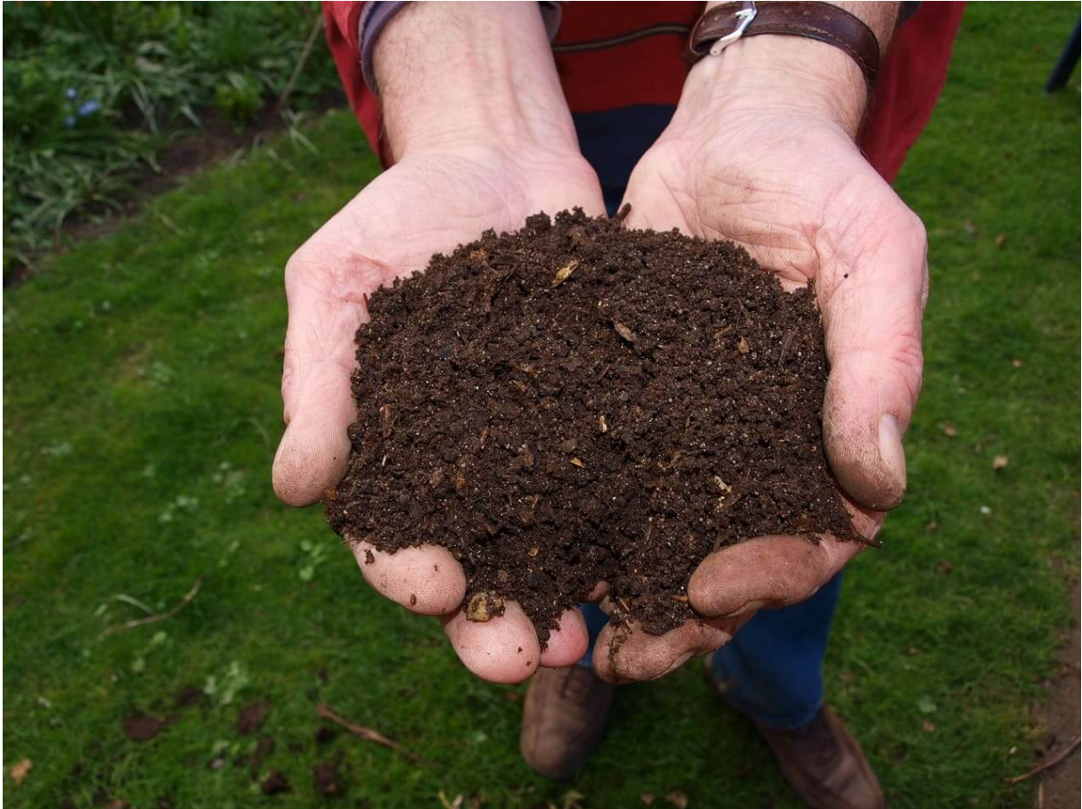
Abbildung 3 Recycelter Humus aus der Trockentrenntoilette ( www.meinetrenntoilette.de )